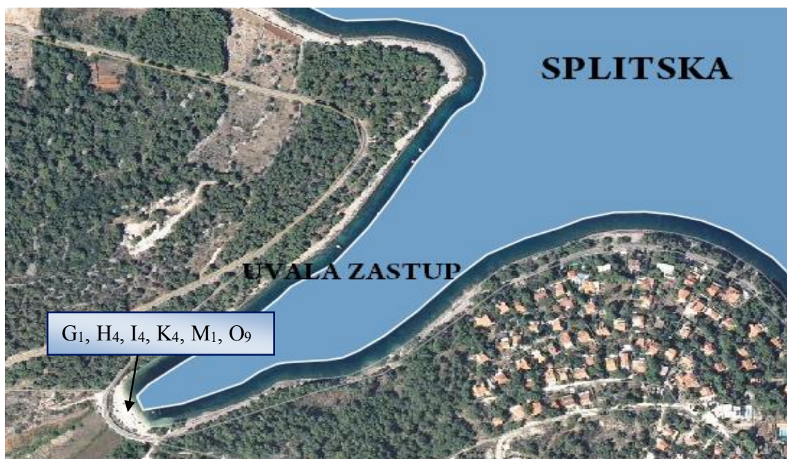
Slika 4. Pomorsko dobro obuhvaćeno ovim Planom na području naselja Splitska