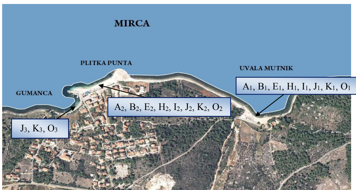
Slika 1. Pomorsko dobro obuhvaćeno ovim Planom na području naselja Mirca